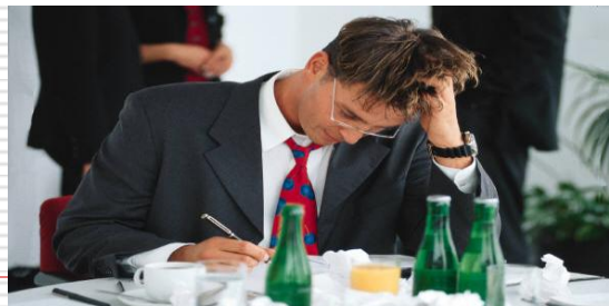
pravidla práce se skupinou